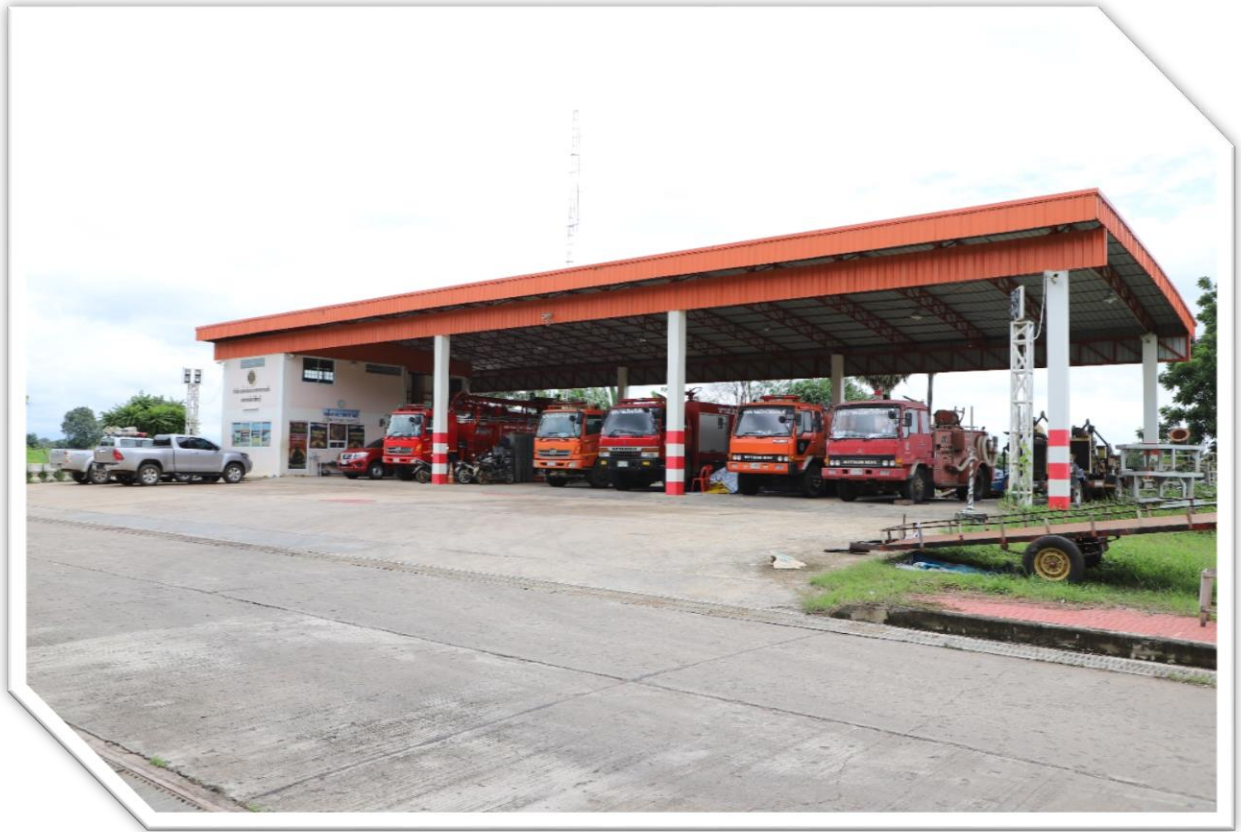
อาคารงานป้องกันและบรรเทาสาธารณภัย