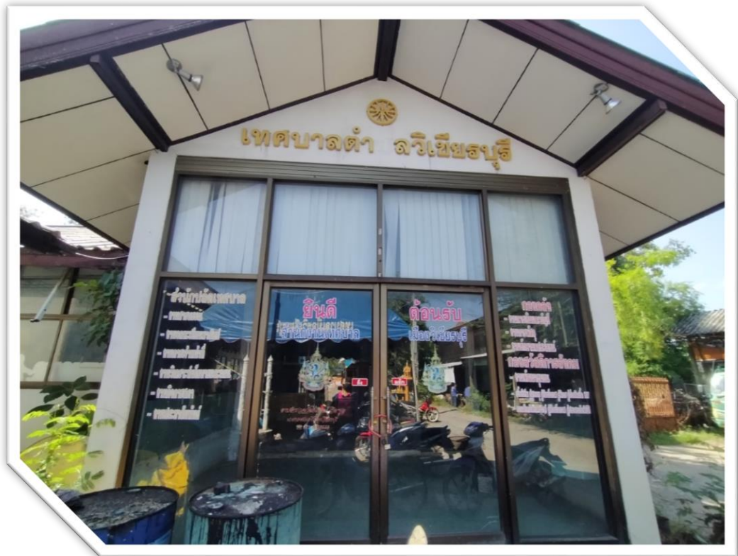
อาคารที่ทำการสุขาภิบาลตำบลวิเชียรบุรีและเทศบาลตำบลวิเชียรบุรี