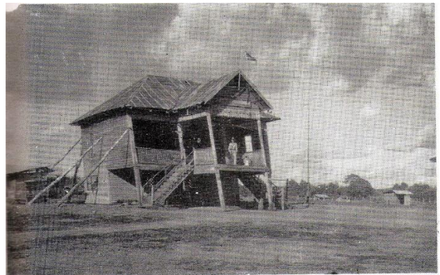
สถานีตำรวจอำเภอวิเชียรบุรี