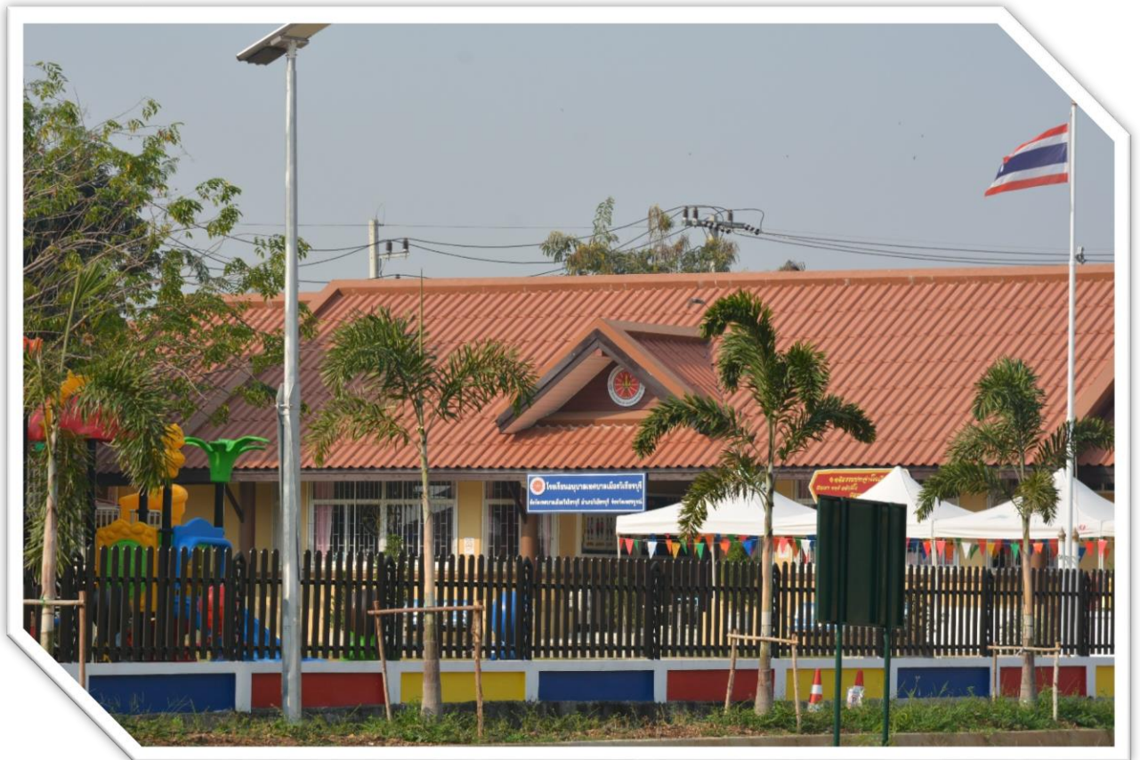
โรงเรียนอนุบาลเทศบาลเมืองวิเชียรบุรี