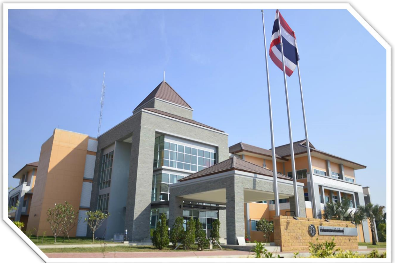
อาคารสำนักงานเทศบาลเมืองวิเชียรบุรี หลังใหม่

ในบริเวณเดียวกันกับสำนักงานเทศบาลเมืองวิเชียรบุรี มีโรงเรียนอนุบาลเทศบาลเมืองวิเชียรบุรี ศูนย์พัฒนาเด็กเล็กศาลสมเด็จพระนเรศวรมหาราช อาคารงานป้องกันและบรรเทาสาธารณภัย และสนามกีฬา เทศบาลเมืองวิเชียรบุรี