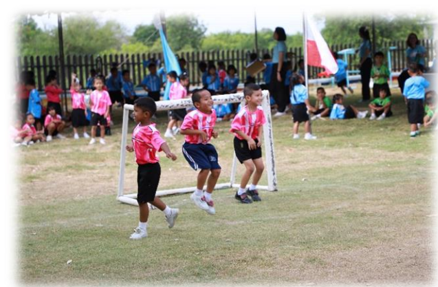
ศูนย์พัฒนาเด็กเล็กศาลสมเด็จพระนเรศวรมหาราช