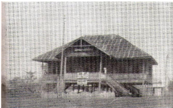
ที่ว่าการอำเภอวิเชียรบุรี