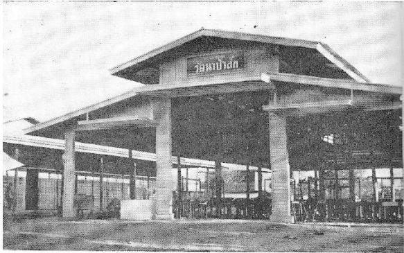
ตลาดสาธารณะสุขาภิบาลวิเชียรบุรี สร้างเสร็จและเปิด จำหน่ายสินค้าเมื่อ พ.ศ. ๒๕๐๗

สุขาภิบาลวิเชียรบุรีแต่เดิม มีอาคารที่ว่าการอยู่ที่บริเวณ หน้าว่าการอำเภอวิเชียรบุรี ซึ่งในสมัยนั้น เป็นถนนเส้นสำคัญในการสัญจรของชาววิเชียรบุรี เนื่องจาก เป็นสถานที่ตั้งของสถานที่สำคัญในอำเภอวิเชียรบุรี ทั้งสิ้น ได้แก่ ตลาดสดสุขาภิบาล ที่ว่าการอำเภอวิเชียรบุรี สถานีอนามัยอำเภอวิเชียรบุรี สถานีตำรวจอำเภอวิเชียรบุรี โรงเรียนท่าโรง