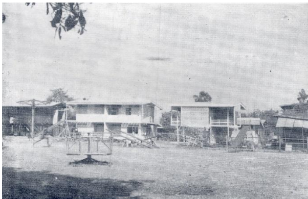
บ้านพักข้าราชการกรมอนามัย อำเภอวิเชียรบุรี สร้างเสร็จเมื่อ พ.ศ. ๒๕๐๗