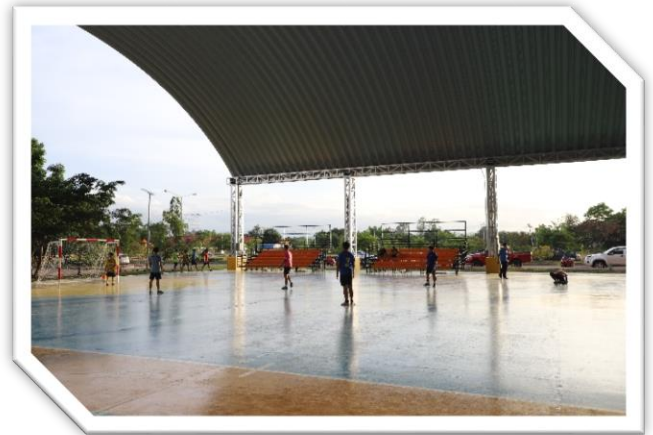
สนามกีฬาเทศบาลเมืองวิเชียรบุรี