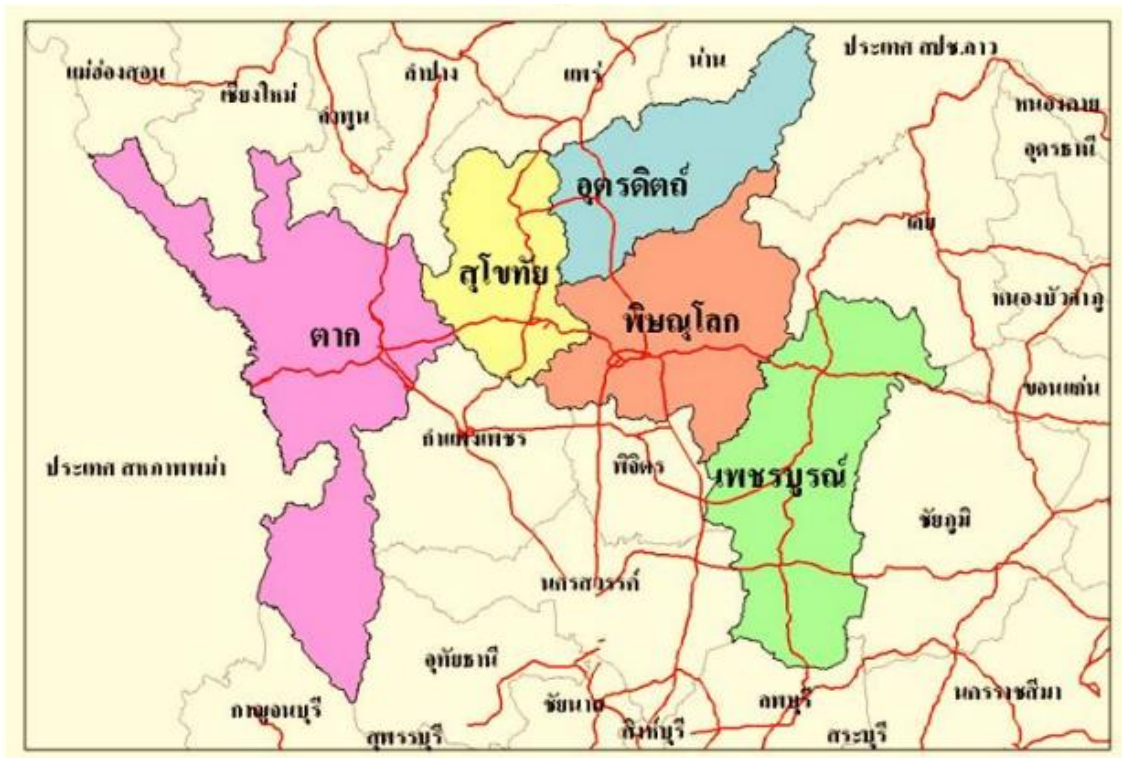
แผนที่แสดงอาณาเขตของกลุ่มจังหวัดภาคเหนือตอนล่าง 1