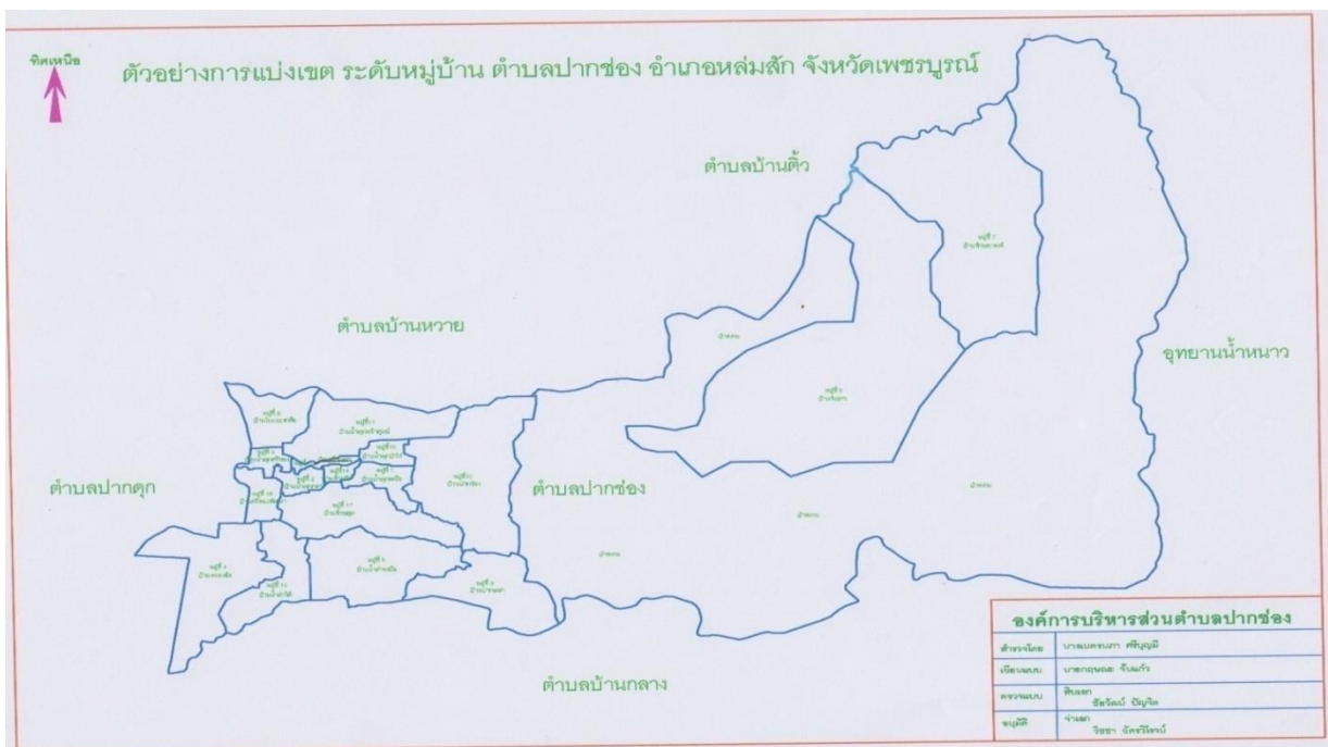
แผนที่ตำบลปากช่อง อำเภอหล่มสัก จังหวัดเพชรบูรณ์

ตำบลปากช่อง มีพื้นที่ส่วนใหญ่เป็นราบเชิงภูเขา ซึ่งเป็นพื้นที่ติดป่าสงวน เป็นที่อยู่อาศัยและพื้นที่ทำการเกษตรที่อุดมสมบูรณ์