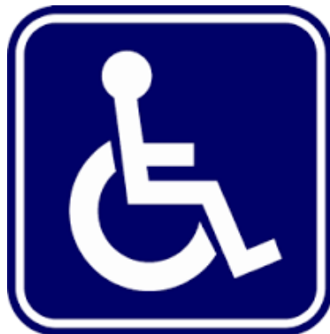
สัญลักษณ์ผู้พิการ